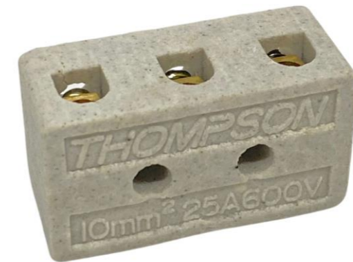
CONECTOR DE PORCELANA 3 POLOS 10MM