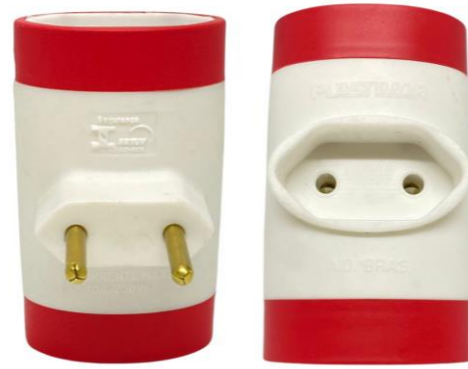
PINO 3 SAÍDAS