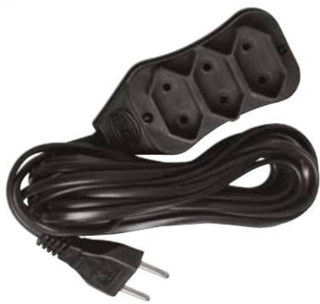
EXTENSÃO CABO PP 2X0,75MM