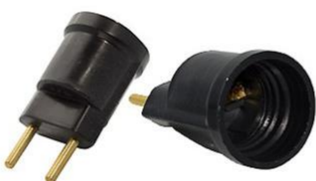
PINO PORTA LÂMPADA