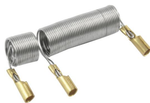
RESISTÊNCIA SIMILAR P/ CHUVEIRO LORENZETTI 5500W