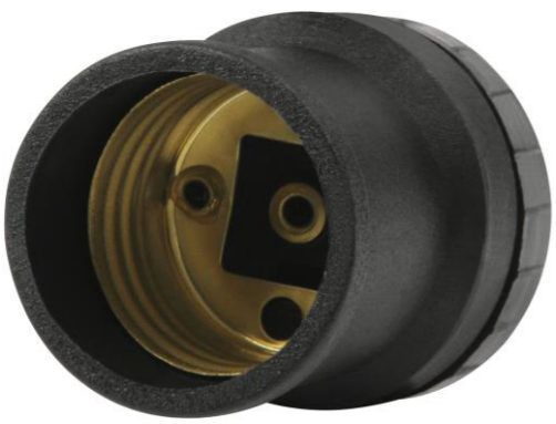
SOQUETE SEM CHAVE