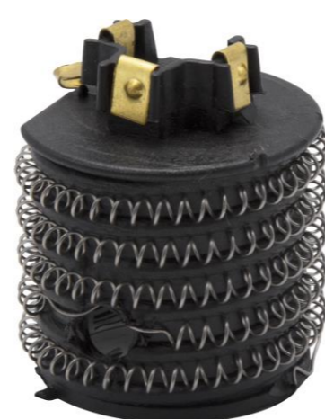
RESISTÊNCIA SIMILAR P/ DUCHA CORONA GDCHA 220V 5400W