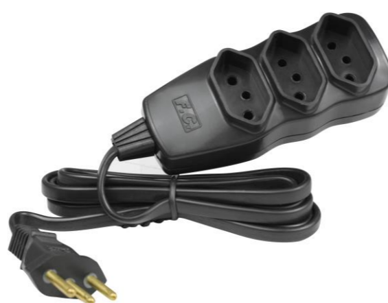
EXTENSÃO CABO PP 2P + T 3X0,75MM 3M