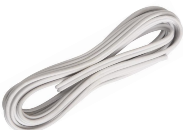
FIO PARALELO 2X0,50MM 5M