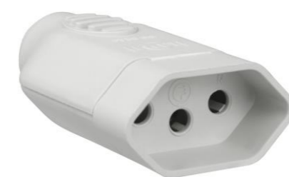
UNIÃO FÊMEA 2 POLOS + TERRA 20A