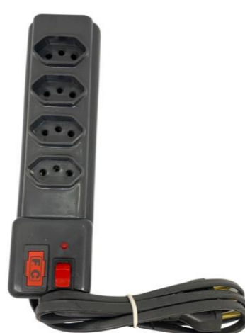
FILTRO DE LINHA NEW 4 TOMADAS 1,20M BC