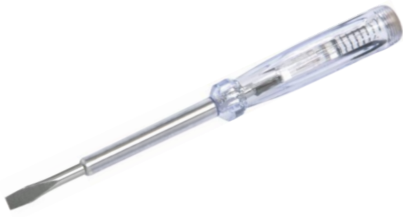
CHAVE TESTE 16CM