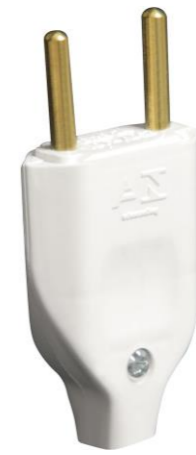
PINO MACHO MACIÇO 10A