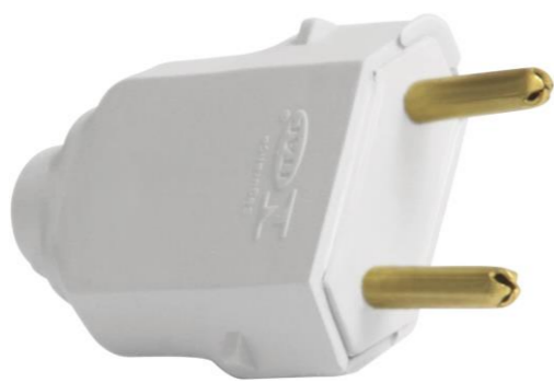
PINO MACHO OCO