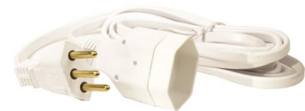
CORDÃO PROLONGADOR PP 2P + T 3X0,75MM M/F 10A 3M