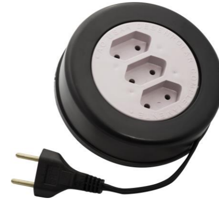
EXTENSÃO REDONDA 5 METROS