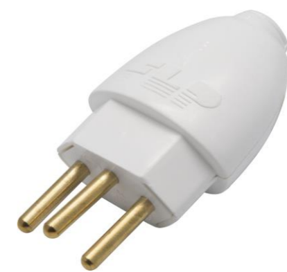
PINO 2 POLOS + TERRA 20A