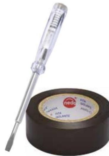
FITA ISOLANTE 5M + CHAVE FENDA TESTE 16CM