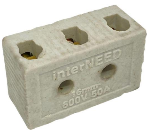
CONECTOR DE PORCELANA 3 POLOS 16MM