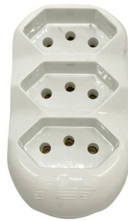
PINO 3 SAÍDAS 2P + TERRA RETO