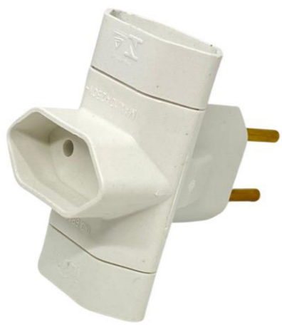
PINO 3 SAÍDAS MACIÇO