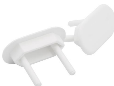
PROTETOR PARA TOMADA (4 UN.)