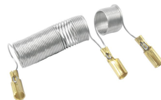
RESISTÊNCIA SIMILAR P/ CHUVEIRO LORENZETTI 4400W