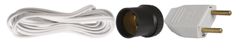
KIT EXT PORTA LAMPADA 2M (PINO, FIO, BOCAL)