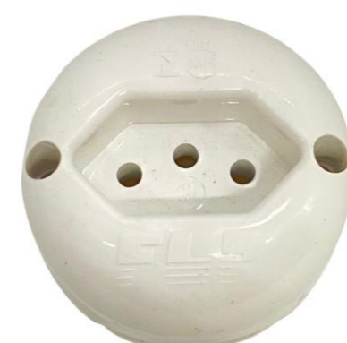
TOMADA EXTERNA 2P+T