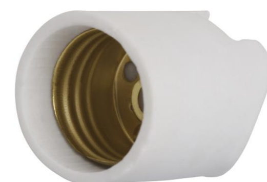
RECEPTÁCULO DE PORCELANA