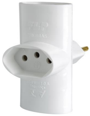
PINO 3 SAÍDAS COM TERRA