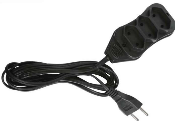
EXTENSÃO CABO PARALELO 2X0,75MM