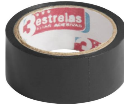
FITA ADESIVA PLÁSTICA PRETA