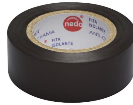
FITA ISOLANTE EXTRA ANTI-CHAMA