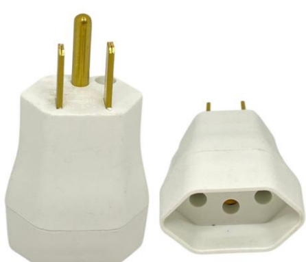
PINO ADAPTADOR 2 POLOS + TERRA REVERSO