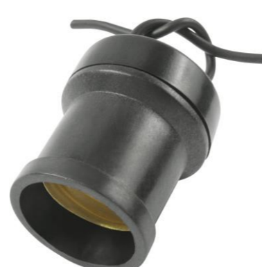
SOQUETE COM RABICHO