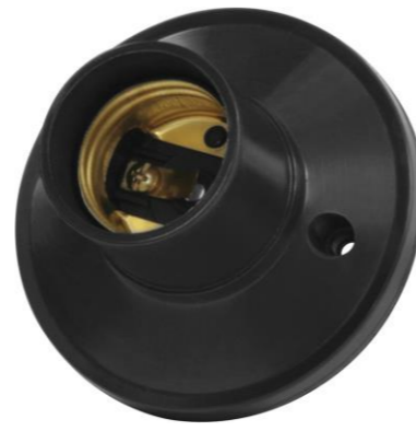
SOQUETE P/ TETO FIXO RETO