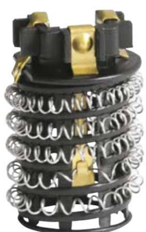
RESISTÊNCIA SIMILAR P/ DUCHA CORONA 4400W