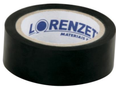
FITA ISOLANTE ESPECIAL 5M