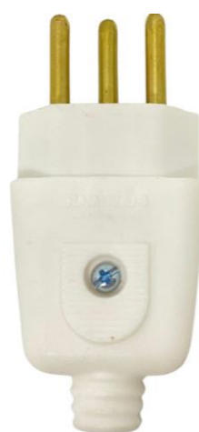
PINO MACHO 2 POLOS + TERRA 10A