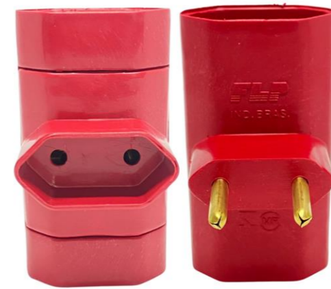
PINO 3 SAÍDAS VERMELHO